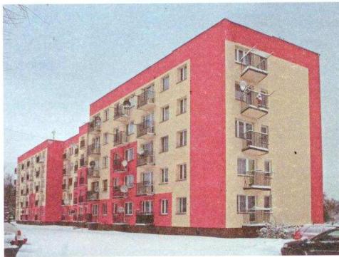
...i po termomodernizacji